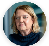
Geschäftsführendes Vorstandsmitglied, Schriftführerin