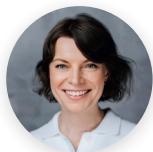
Ihre Emmi Zeulner, MdB Vorstandsvorsitzende