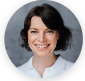
Vorsitzende Emmi Zeulner

Bundestagsabgeordnete | Mitglied im Ausschuss für Gesundheit im Deutschen Bundestag